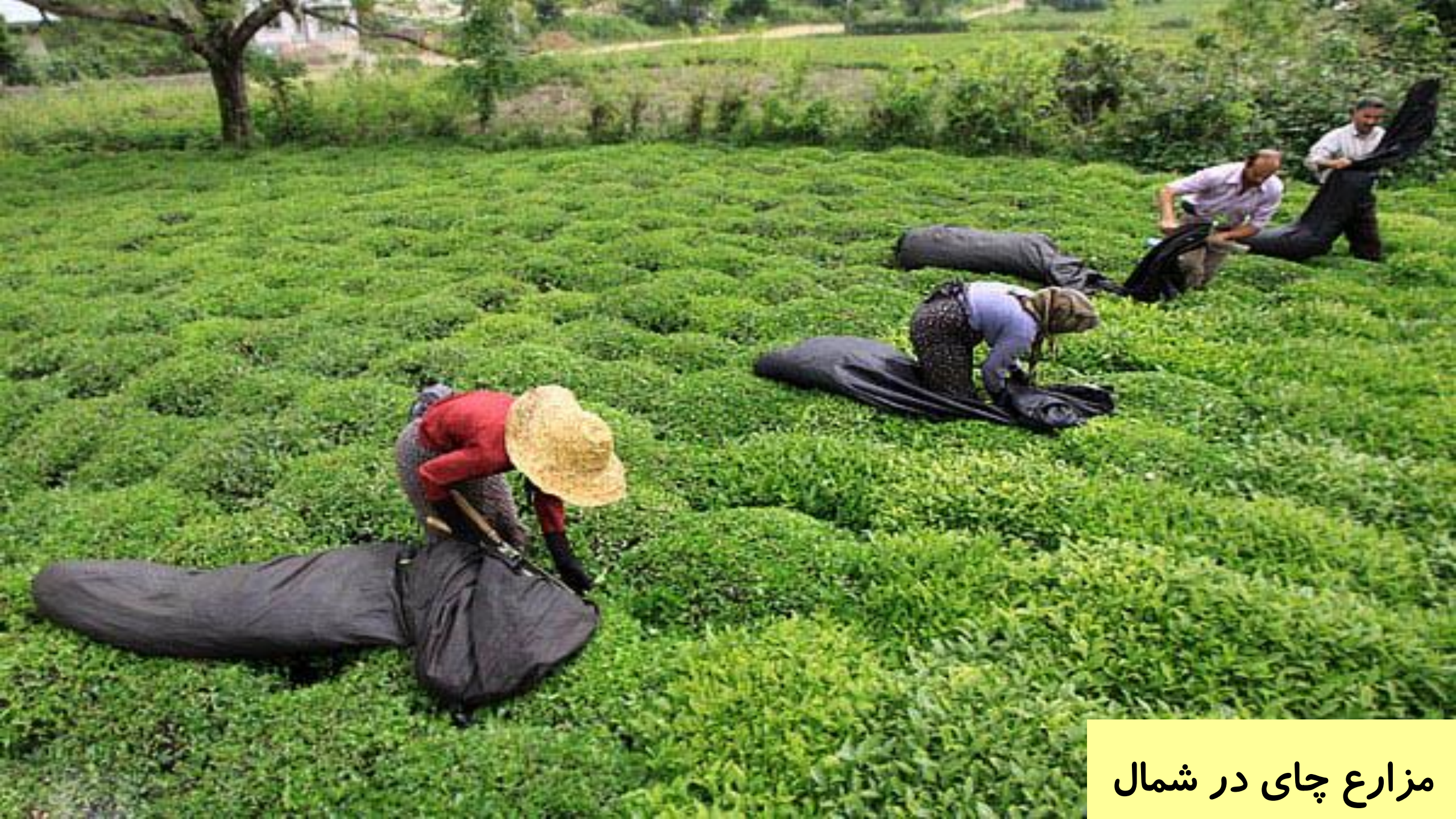
مزارع چای در شمال