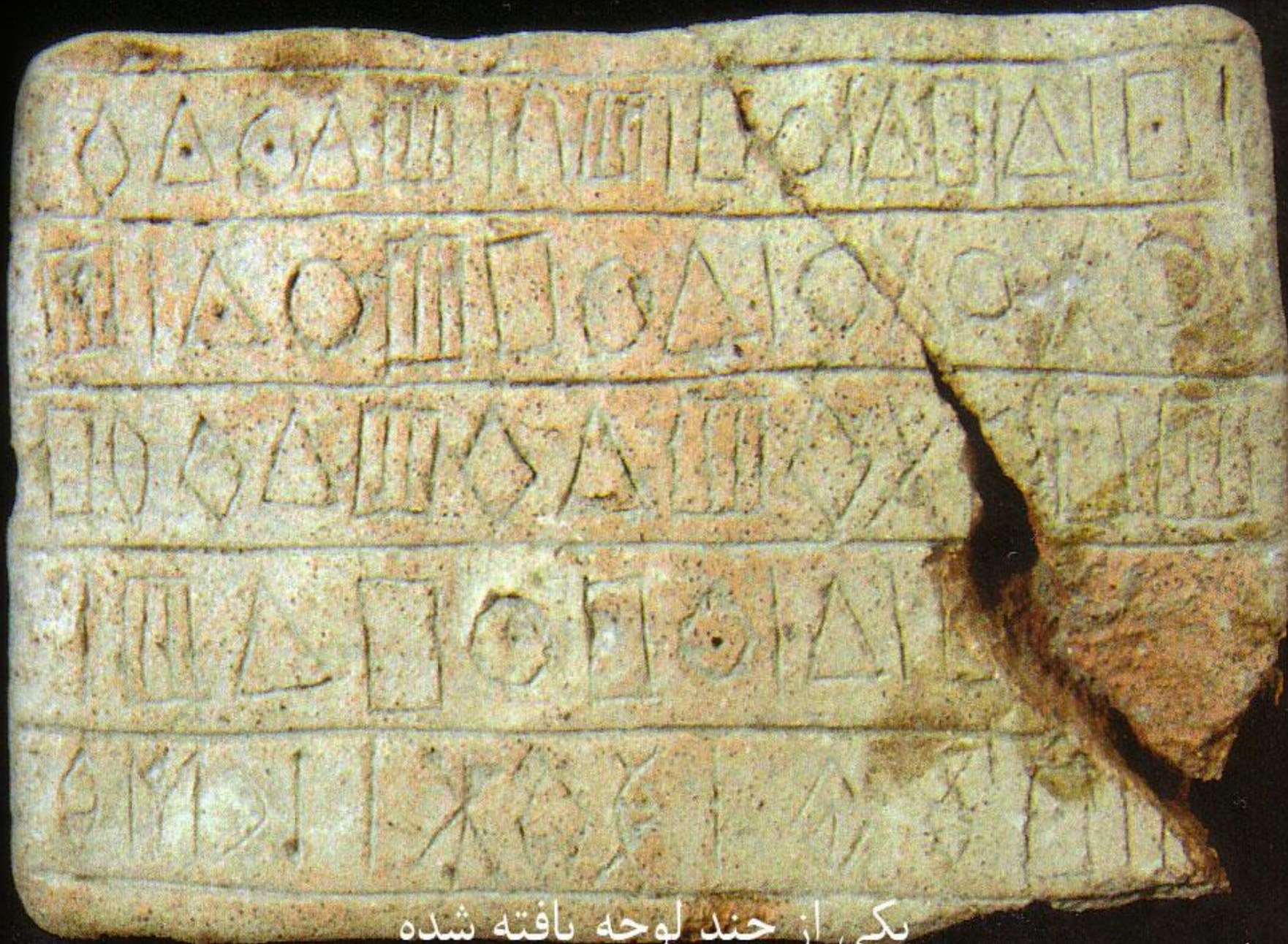
یکی از چند لوحه یافته شده