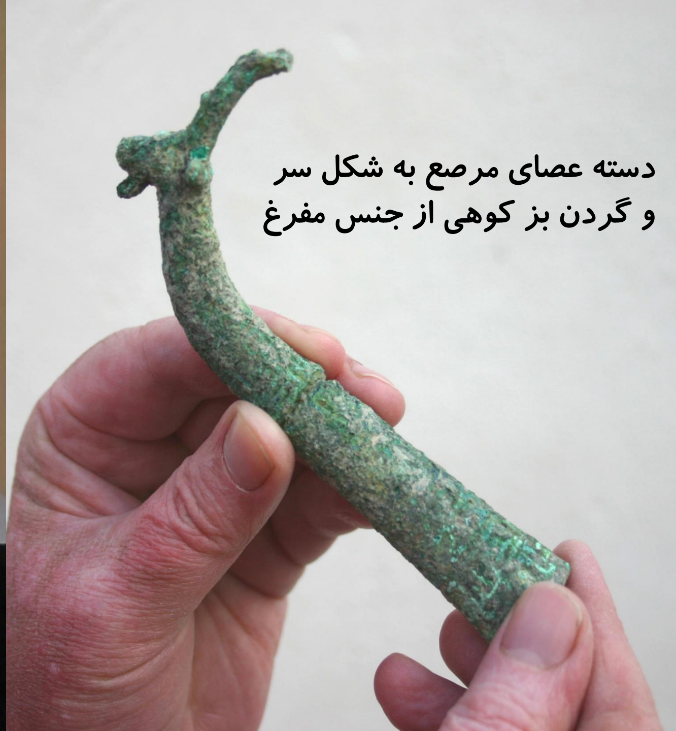
دسته عصای مرصع به شکل سر و گردن بز کوهی از جنس مفرغ