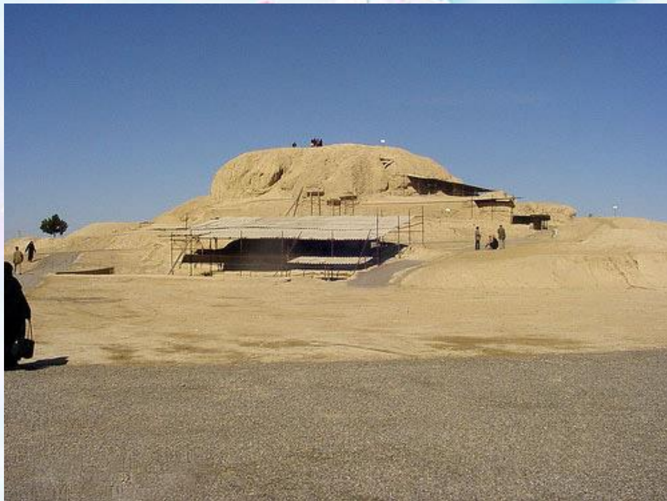
تپه سیلک کاشان

در بعضی از نقاط ایران مانند تپه سیلک در کاشان و تپه حسن لو در آذربایجان غربی ظروف و وسایلی از زندگی مردم این دوره پیدا شده است.