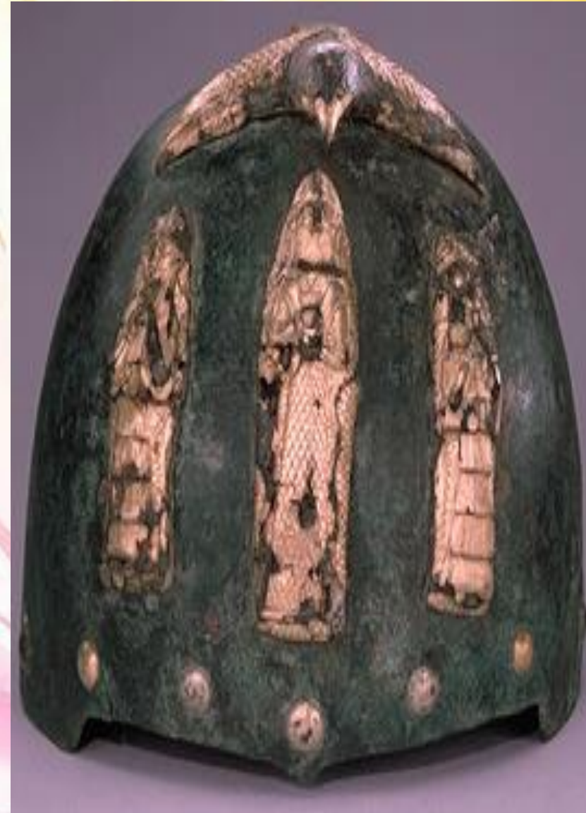
کلاه خود پرنده و سه پیکر