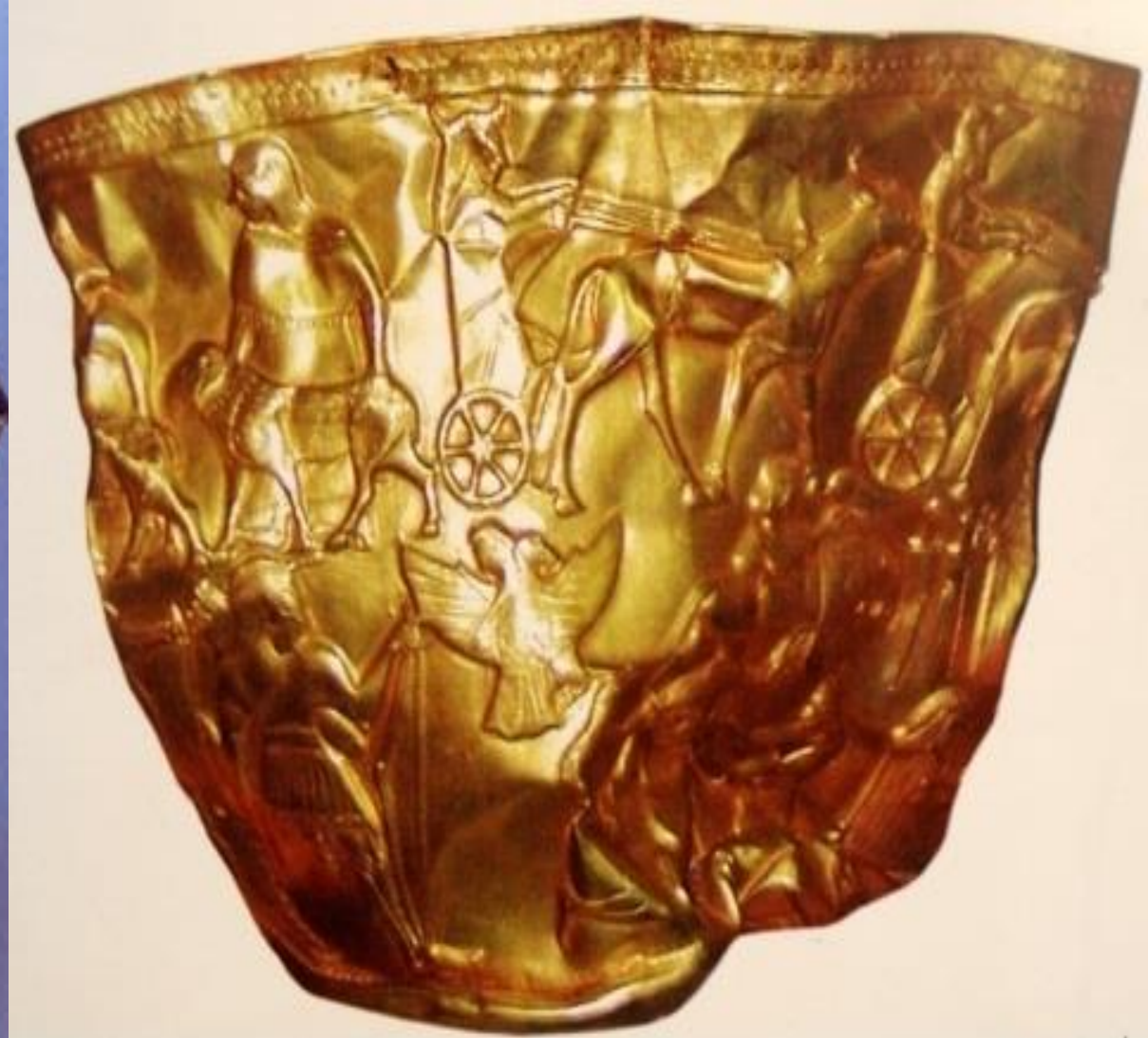
جام طلائی تپه حسن لو