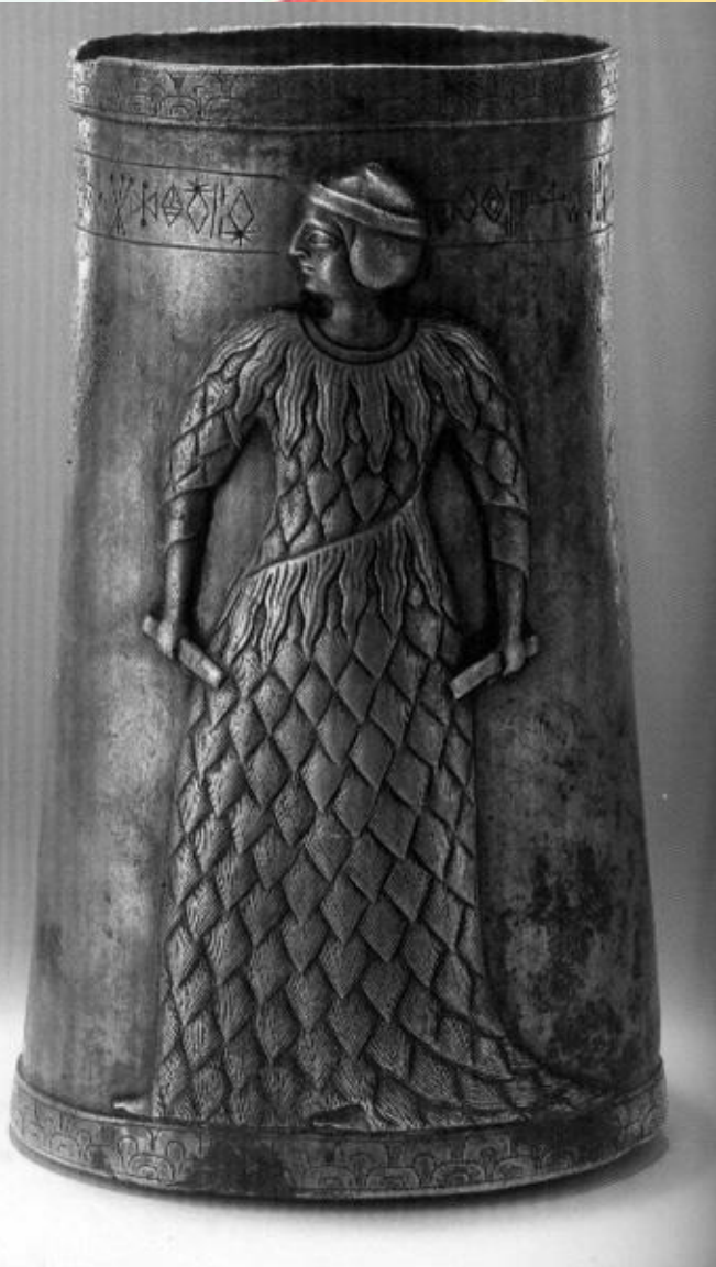
جام نقره ای زن ایلامی