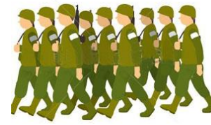
B: I watch military p.....