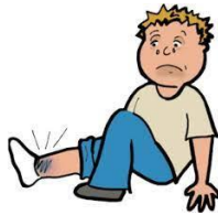
A: He twisted his a.....

با توجه به تصاویر و با استفاده از اولین حرف داده شده، جاهای خالی را با کلمات مناسب پر کنید.