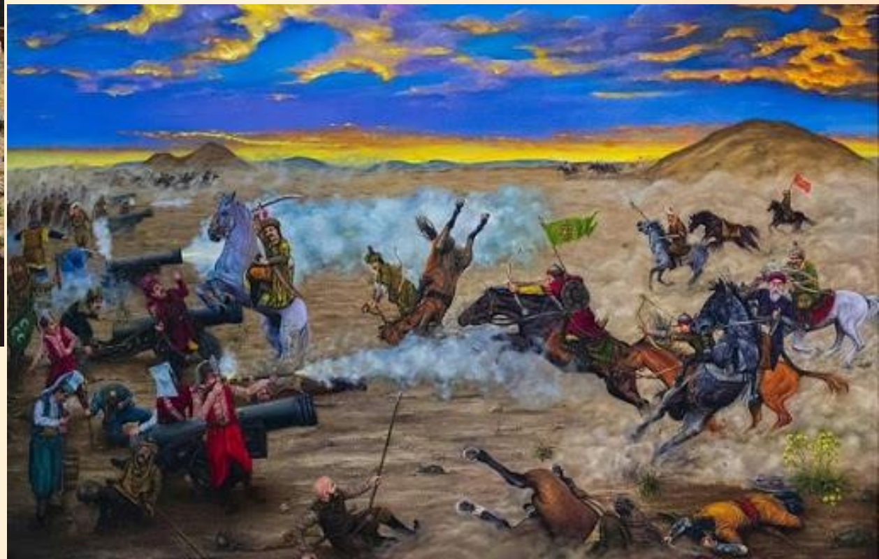
جنگ چالدران به روایت تصویر