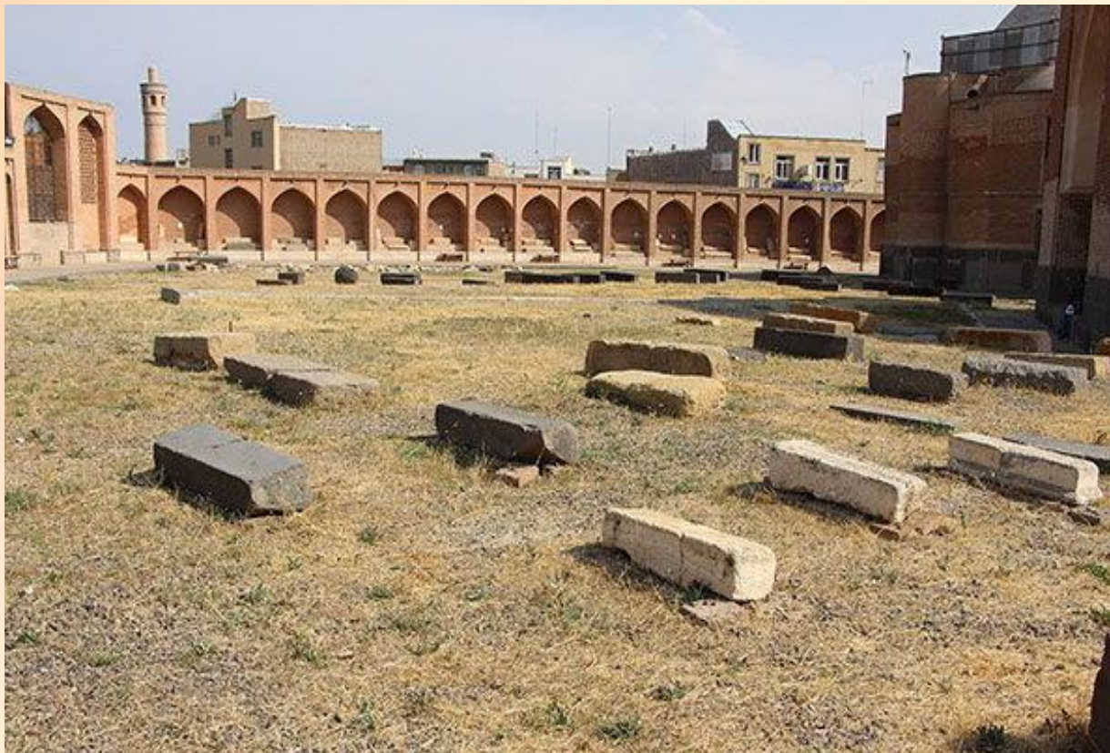
مقبره شهدای جنگ چالدران