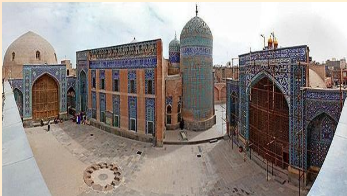
بقعه شیخ صفی الدین اردبیلی

شیخ صفی الدین اردبیلی ← صوفی معروف / دارای پیروان و هواداران بسیار / دارای خانقاه مهم ترین طرفداران خانقاه شیخ صفی = ایل های مختلف ترک (قرنلباش)