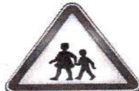
محل عبور دانش آموزان