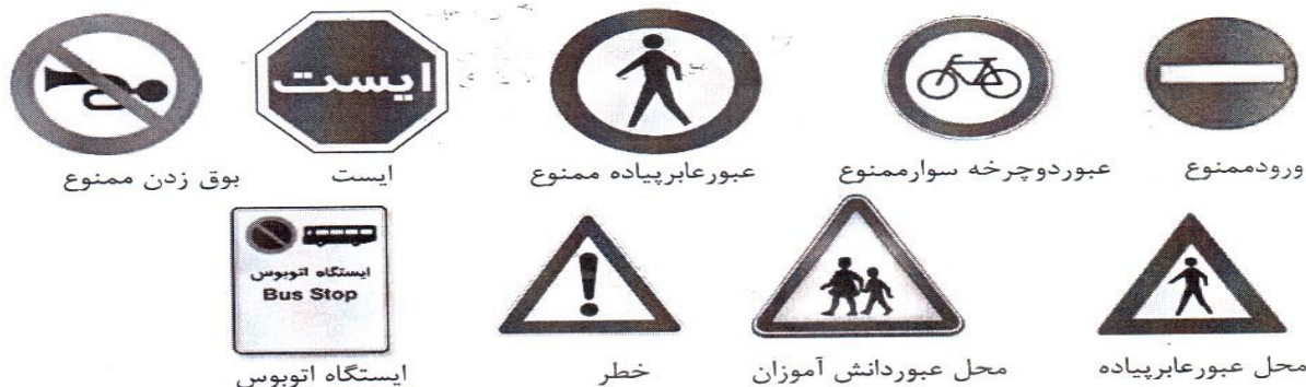
بوق زدن ممنوع

۵- هر یک از تابلوهای زیر چه نشانه‌ای هستند و چه پیامی برای ما دارند؟