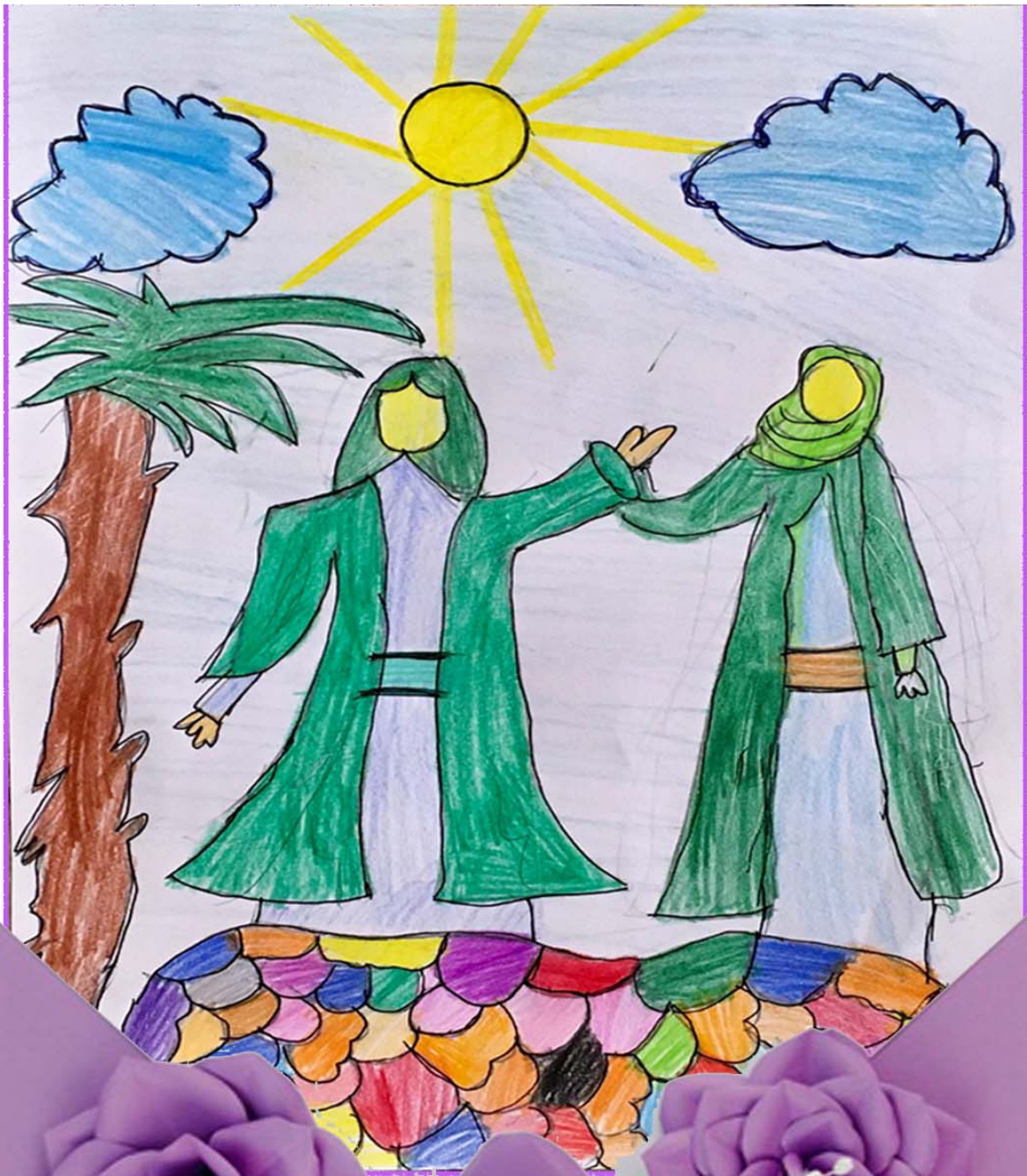
فاطمه خورشیدی، پایه دوم