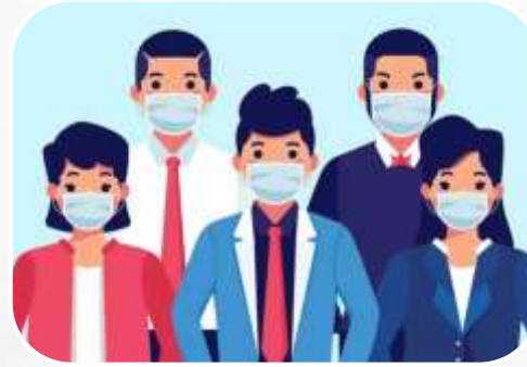
امنیت جسمی و فردی